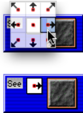
Εικόνα 2. Τα προγράμματα στον Απτικό Προγραμματισμό είναι δυναμικά και περιλαμβάνουν χειρισμούς, όπως ο καθορισμός παραμέτρων με τη χρήση οπτικών πεδίων

Με τη διαδικασία της μεταφοράς (drag and drop) δομικών στοιχείων της γλώσσας στον επεξεργαστή συμπεριφορών, τα προγράμματα αυτού του τύπου αναπτύσσονται αυξητικά, μέσα σε όρια ξεκάθαρα ορισμένα, κάνοντας απλούστερη την ανάπτυξη προγραμμάτων. Αυτή η μέθοδος προσφέρει άμεση ικανοποίηση και επιτρέπει τη βαθμιαία ανάπτυξη της επιδεξιότητας, που είναι πολύ σημαντική σε οποιοδήποτε είδος προγραμματισμού, και ειδικά στην ανάπτυξη προγραμμάτων από τελικούς χρήστες, οι οποίοι δεν είναι επαγγελματίες προγραμματιστές. Ο απτικός προγραμματισμός με τη VAT, επιτρέπει στους χρήστες να «παίζουν» με οποιοδήποτε κομμάτι της γλώσσας και να διερευνήσουν τη λειτουργικότητα της με ένα άμεσο τρόπο. Κάθε δομικό στοιχείο της γλώσσας, οποιαδήποτε στιγμή, μπορεί να μεταφερθεί πάνω σε οποιονδήποτε πράκτορα. Το δομικό στοιχείο θα εκτελεστεί δίνοντας οπτική ανατροφοδότηση που αποκαλύπτει τις συνθήκες που είναι αληθείς ή ψευδείς και παρουσιάζει τις συνέπειες των εκτελεσμένων δράσεων. Τα μέρη του προγράμματος μπορούν να ελεγχθούν σε όλα τα επίπεδα: συνθήκες / δράσεις, κανόνες και μέθοδοι. Για παράδειγμα, μεταφέροντας την εντολή Move από τη συλλογή