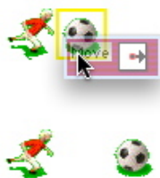
Εικόνα 3. Το δομικό στοιχείο θα εκτελεστεί δίνοντας οπτική ανατροφοδότηση που αποκαλύπτει τις συνθήκες που είναι αληθείς ή ψευδείς και παρουσιάζει τις συνέπειες των εκτελεσμένων δράσεων

δράσεων πάνω στον πράκτορα Μπάλα στο πεδίο εργασίας θα έχει ως αποτέλεσμα τη μετακίνηση της μπάλας προς τα δεξιά όπως φαίνεται και στην εικόνα 3. Οι συνθήκες, όταν μεταφερθούν πάνω σε πράκτορες, θα αποκαλύψουν αν η συνθήκη ισχύει για τον πράκτορα, ελέγχοντας τη συνθήκη στο τρέχον πλαίσιο. Μεταφέροντας ένα ολόκληρο κανόνα πάνω σε ένα πράκτορα θα ελεγχθεί ολόκληρος ο κανόνας. Βήμα-βήμα ελέγχονται όλες οι συνθήκες δίνοντας οπτική ανατροφοδότηση. Ο απτικός προγραμματισμός με τα επιμέρους ελεγχόμενα τμήματα σε διαφορετικά επίπεδα της γλώσσας προγραμματισμού (εντολές, κανόνες, μέθοδοι) παρέχει εύκολη και σταδιακή εκσφαλμάτωση, ακόμη και για τον τελικό χρήστη που δεν κατέχει τις ικανότητες και γνώσεις ενός επαγγελματία προγραμματιστή. Με μία τέτοια λοιπόν γλώσσα προγραμματισμού, το AgentSheets δίνει τη δυνατότητα σε μη προγραμματιστές να δημιουργήσουν συμπεριφορές πρακτόρων που αλληλεπιδρούν σε ολοκληρωμένες προσομοιώσεις.