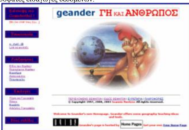
Εικ. 1. Η πρώτη σελίδα (υποδοχής) της πύλης-βάσης ανθρωπογεωγραφικών διδακτικών δεδομένων «Geander - ΓΗ ΚΑΙ ΑΝΘΡΩΠΟΣ»

Η πρώτη σελίδα (υποδοχής) της πύλης-βάσης ανθρωπογεωγραφικών διδακτικών δεδομένων «Geander - ΓΗ ΚΑΙ ΑΝΘΡΩΠΟΣ», που εμφανίζεται στην εικόνα 1, επιτρέπει στον επισκέπτη μια πρώτη καθοδήγηση. Η ζωγραφιά προέρχεται από έργο του Εγγονόπουλου. Εκτός από την πινακίδα «Επίσκεψη στο Geanderthal», που θα εξηγήσουμε αμέσως πιο κάτω, οι άλλες πινακίδες (Επικοινωνία, Αναζητήσεις, Επιλογές, Νέες Σελίδες) έχουν προφανές περιεχόμενο. Μόνο οι πινακίδες «Επίσκεψη στο Geanderthal» και «Νέες Σελίδες» αποτελούν ενεργά links ενώ οι υπόλοιπες αποτελούν επιγραφές των links που βρίσκονται κάτω από αυτές. Οι «Νέες Σελίδες» παραπέμπουν σε πρόσφατες εισαγωγές δεδομένων.