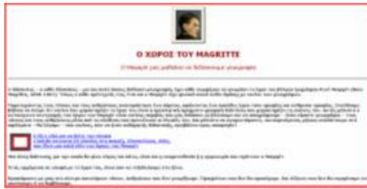
Εικ. 4. Από τη σελίδα «Ο ΧΩΡΟΣ ΤΟΥ MAGRITTE - Ο Μαγκρίτ μας μαθαίνει να διδάσκουμε γεωγραφία»