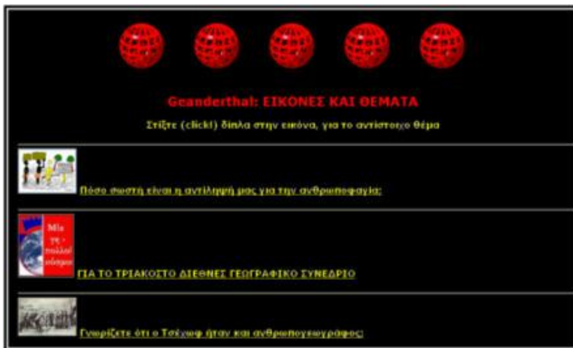
Εικ. 2. Απόσπασμα της σελίδας «Επίσκεψη στο Geanderthal» που επιτρέπει με στίξη (click) τη μετάβαση σε 50 από τα θέματα της βάσης

Από τους 50 τίτλους που έχουμε περιλάβει στην «Επίσκεψη στο Geanderthal» παρουσιάζουμε, για λόγους οικονομίας, περίπου τους μισούς: