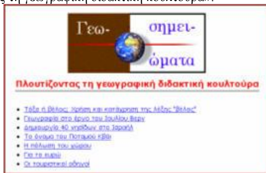
Εικ. 3. Από τη σελίδα «Γεωσημειώματα»

Παρόμοιος πίνακας συγκεντρωμένων θεμάτων υπάρχει και σε άλλη θέση με μερικά μικρότερα «γεωσημειώματα» –παρουσιάζονται μερικοί τίτλοι στην εικ. 3– με τον επεξηγηματικό υπότιτλο «Πλουτίζοντας τη γεωγραφική διδακτική κουλτούρα»: