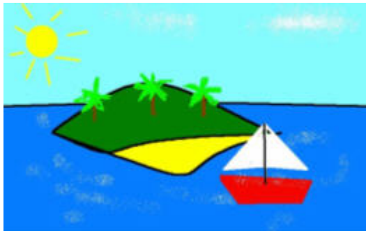
Σχήμα 1. Βραβευμένο έργο παιδιού με κινητικά προβλήματα από το Φυσιοθεραπευτήριο Ειδικής Αγωγής Κορίνθου

τάξη. Στο ρόλο του διάυλου επικοινωνίας και διασύνδεσης οι η/υπολογιστές των σχολικών μονάδων.