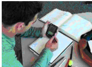
Σχήμα 4: Χρήση Palm Computer στη μάθηση

Το Handheld Devices for Ubiquitous Learning Project (HDUL) με βασικές αρχές του το πώς μπορούν ασύρματες φορητές συσκευές να βοηθήσουν και να επαυξήσουν την διδασκαλία και εκμάθηση των καθηγητών και μαθητών του Harvard ( http://gseacademic.harvard.edu/~hdul/whd-overview.htm ). Την ακαδημαϊκή χρονιά 2003-2004 το έργο HDUL κατάφερε να ενσωματώσει ασύρματες φορητές συσκευές σε οχτώ διαφορετικά προγράμματα σπουδών στο Harvard Graduate School of Education (HGSE) και στο Harvard Extension School (Σχήμα 4).