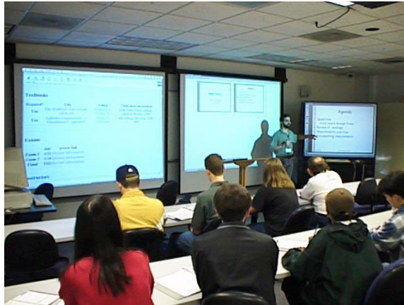
Σχήμα 3: Classroom 2000

Το Handheld Devices for Ubiquitous Learning Project (HDUL) με βασικές αρχές του το πώς μπορούν ασύρματες φορητές συσκευές να βοηθήσουν και να επαυξήσουν την διδασκαλία και εκμάθηση των καθηγητών και μαθητών του Harvard ( http://gseacademic.harvard.edu/~hdul/whd-overview.htm ). Την ακαδημαϊκή χρονιά 2003-2004 το έργο HDUL κατάφερε να ενσωματώσει ασύρματες φορητές συσκευές σε οχτώ διαφορετικά προγράμματα σπουδών στο Harvard Graduate School of Education (HGSE) και στο Harvard Extension School (Σχήμα 4).