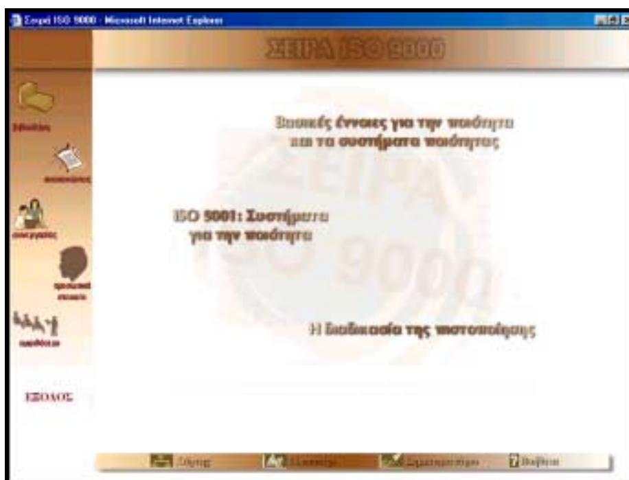
Εικόνα 2: Η αρχική οθόνη της εφαρμογής.

Ανακοινώσεις, οι Συνεργασίες, τα Προσωπικά Στοιχεία, το Αμφιθέατρο και η Έξοδος (βλέπε Εικόνα 2).