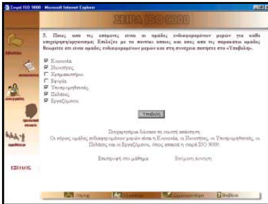
Εικόνα 5: Άσκηση αυτοαξιολόγησης και αποτελέσματα.

Παράλληλα, οι εκπαιδευόμενοι έχουν τη δυνατότητα να διατυπώσουν στον επιστημονικό υπεύθυνο κάποιες απορίες που θα τους δημιουργηθούν κατά την παρακολούθηση του εκπαιδευτικού προγράμματος, με τη χρήση ηλεκτρονικού ταχυδρομείου (e-mail). Ο επιστημονικός υπεύθυνος ελέγχει τα μηνύματα σε καθημερινή βάση για το χρονικό διάστημα που διαρκεί το πρόγραμμα και απαντά στις ερωτήσεις των εκπαιδευομένων. Μπορούν επίσης να στείλουν μηνύματα στον κατάλογο των εκπαιδευομένων, διατυπώνοντας απορίες, προτάσεις και παρατηρήσεις. Οι ερωτήσεις και οι απαντήσεις μέσω του ηλεκτρονικού ταχυδρομείου (e-mail) διακινούνται μέσα στην ομάδα των εκπαιδευομένων, με τη χρήση ταχυδρομικού καταλόγου (mailing list), και καταγράφονται για να χρησιμοποιηθούν στη βελτίωση του εκπαιδευτικού προγράμματος.