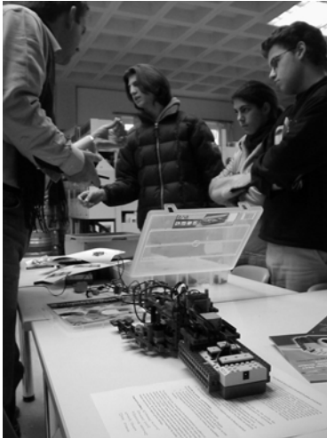
Εικόνα 3: Οι μαθητές ενημερώνονται για τις σχεδιαστικές απαιτήσεις το μοντέλου τηλεσκοπίου και δεξιά επιχειρούν τα πρώτα στάδια κατασκευής του.

Το καινοτόμο αυτό πρόγραμμα ενισχύεται με το δεύτερο εκπαιδευτικό εργαλείο που έχει προταθεί για να συμβάλει στην εποπτεία του τηλε-ελέγχου και επιπλέον εξοικείωση με το ρομποτικό τηλεσκόπιο (AM). Πρόκειται για ένα μοντέλο τηλεσκοπίου υπό κλίμακα το οποίο θα ενημερώνεται απευθείας για τις κινήσεις του ρομποτικού τηλεσκοπίου (AM) και θα κινείται ταυτόχρονα με αυτό, χρησιμοποιώντας την δικτυακή πλατφόρμα διαχείρισης.