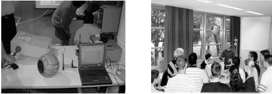
Σχήμα 2: Εικόνες από τις πρώτες πειραματικές δραστηριότητες στο σχολικό εργαστήριο με την έξυπνη μπάλα. Στο μέσο της αριστερής φωτογραφίας διακρίνεται ο σταθμός βάσης.

πληροφορία συνδυάζεται στη συνέχεια για τον προσδιορισμό στον τρισδιάστατο χώρο, αντικειμένων με ακρίβεια μόλις μερικών εκατοστών.