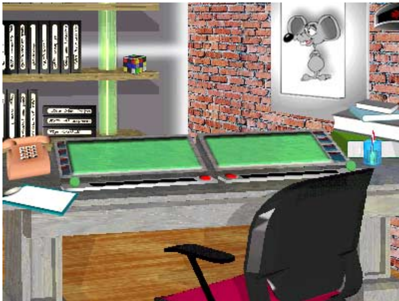
Εικόνα 1: Η διεπαφή χρήστη στον κεντρικό χώρο εργασίας στο ΠΕΡΙΒΑΛΛΟΝ

Ο χώρος εργασίας (εικ. 1) περιλαμβάνει μια ταινιοθήκη, ένα τηλέφωνο, δύο κονσόλες εργασίας, διάφορα βιβλία-εγχειρίδια, ένα πίνακα καταγραφής εργασιών προς εκτέλεση, ένα κύβο του Rubik (παιγνίδι) και τον ήρωα-βοηθό. Σε κάθε στιγμή ο χρήστης μπορεί να έχει ενεργοποιημένο ένα κύριο τμήμα του χώρου εργασίας αλλά πολύ εύκολα μπορεί να ενεργοποιήσει - μεταπηδήσει σε κάποιο άλλο (χρήση "χάρτη" χώρου εργασίας). Στον πίνακα καταγραφής εργασιών και μόνο για τους μαθητές χρήστες αναφέρονται όλες οι εργασίες που πρέπει να εκτελεστούν (π.χ. σύνταξη μιας μελέτης μετά από έρευνα του υλικού, καταγραφή πληροφοριών μετά από εκτέλεση πειράματος κ.λ.π.).