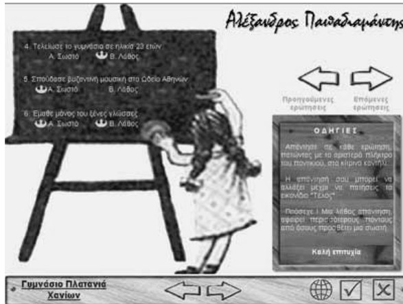
Εικόνα 2: Η περιοχή των «Ερωτήσεων»