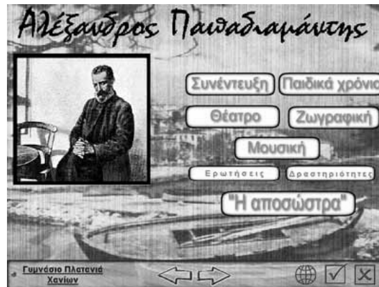
Εικόνα 1: Η κεντρική οθόνη της εφαρμογής

Το δεύτερο είναι αφιερωμένο στο κείμενο της «Αποσώστρας» και παρουσιάζει : Το πρωτότυπο κείμενο, παράλληλα κείμενα, ερωτήσεις, δραστηριότητες και μια ταινία σκίτσων που στηρίζεται στη θεατρική διασκευή των μαθητών στο κείμενο της «Αποσώστρας»