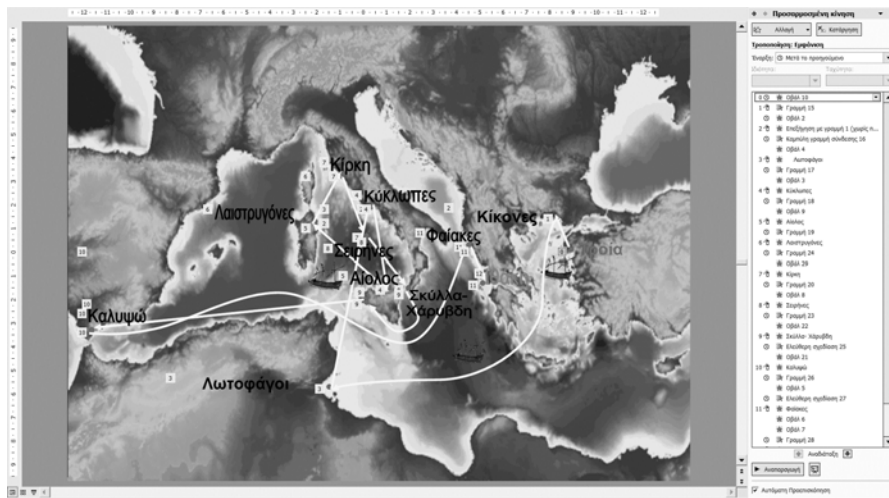
Σχήμα 1: Τα ταξίδια του Οδυσσέα

ομάδες δύο ή τριών μαθητών ανέλαβε μία ή δύο από τις παραπάνω διεργασίες και την ολοκλήρωσε με επιτυχία. Τέλος, έγινε η σύνθεση των έργων των τριών ομάδων σε ένα ενιαίο σύνολο.