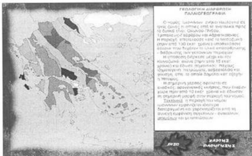
Σχήμα 3. Οθόνη της ενότητας "Γεωλογία-Παλιαιογεωγραφία"