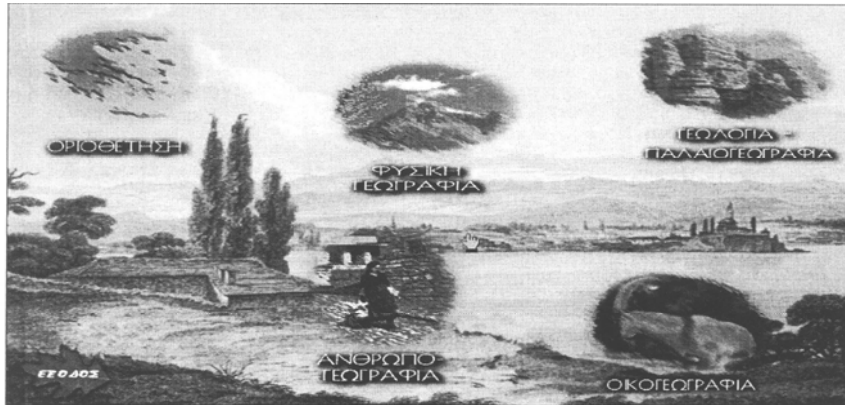
Σχήμα 2. Οθόνη με το κεντρικό μενού της εφαρμογής

Οι υποενότητες, στις οποίες είναι δυνατή η πλοήγηση μέσα από κάθε ενότητα, είναι οι εξής: