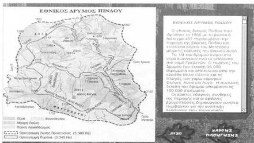
Σχήμα 4. Οθόνη της ενότητας "Οικογεωγραφία"