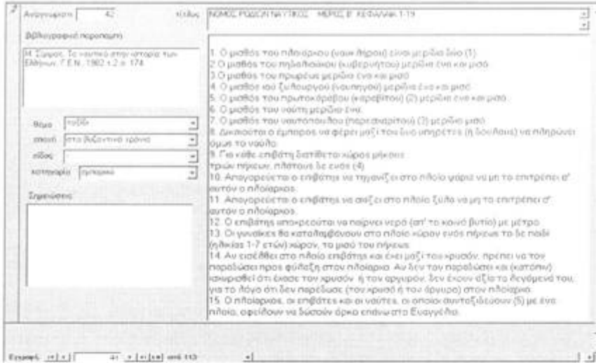
Σχήμα 2. Εγγραφή από τη φόρμα των γραπτών πηγών

σύνολο των πηγών κατά είδος (γραπτές πηγές, ηχητικές, πηγές ...) είτε με τη χρήση συγκεκριμένου φίλτρου ή φίλτρων, διαχειριζόμαστε ένα πολύ μεγάλο αριθμό πληροφοριών, επιλέγοντας κάθε φορά εκείνες που θα μας επιτρέψουν να προσεγγίσουμε πολλαπλά τα ερωτήματα που η σχολική ομάδα αναδεικνύει ως σημαντικά (Σχήματα 2 και 3).