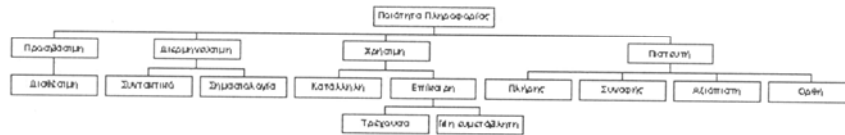
Σχήμα 1. Μια ιεραρχία των διαστάσεων της ποιότητας της πληροφορίας

2. Η ποιότητα της πληροφορίας είναι μια ιεραρχική δομή των διαστάσεων που την αφορούν (Σχήμα 1)