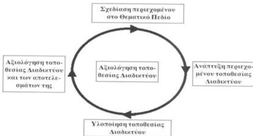
Σχήμα 3. Γενικό Μοντέλο Αξιολόγησης μιας τοποθεσίας Διαδικτύου