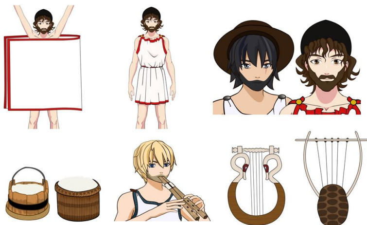
Σχήμα 3. Ορισμένες από τις αναπαραστάσεις των λαογραφικών στοιχείων που εμφανίζονται στο παιχνίδι. Κοντός χιτώνας (πάνω αριστερά), κόμη, γένια (πάνω δεξιά), καπέλο πίλος (γωνία πάνω δεξιά) γαυλός και τυροβόλι (κάτω αριστερά), αυλητής με διάυλο (κάτω κέντρο), λύρα και κιθάρα (κάτω δεξιά)

Με την ολοκλήρωση του παιχνιδιού οι μαθητές αναμένεται να: