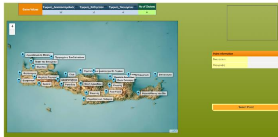
Σχήμα 2. Το “Escaperlan” σε περιβάλλον χρήσης Play Mode

Το “Escaperlan” σχεδιάστηκε και αναπτύχθηκε στην πλατφόρμα ChoiCo. Όπως φαίνεται και στο Σχήμα 2, στην οθόνη “Play Mode” υπάρχει στα αριστερά ένας χάρτης της Κρήτης στον οποίο προβάλλονται 23 σημεία σχετικά με τα μέρη και τις δραστηριότητες που μπορεί να κάνει κανείς. Στη δεξιά πλευρά της οθόνης υπάρχουν δύο ψηφίδες, η ψηφίδα “Point Information” και η ψηφίδα “Game values”. Στην πρώτη ο παίκτης παρατηρεί τις ιδιότητες του ενεργού επιλεγμένου σημείου στο χάρτη, ενώ στη δεύτερη βλέπει πώς επηρέασε η επιλογή του εκάστοτε επιλεγμένου σημείου τις μεταβλητές του παίκτη.