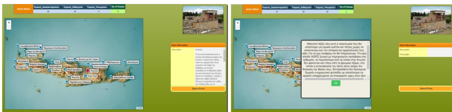
Σχήμα 3. Επιχείρημα και αντεπιχείρημα για το σημείο «Κνωσός»

Για κάθε σημείο του χάρτη προβάλλεται στον παίκτη ένα επιχείρημα υπέρ του σημείου. Ωστόσο, μόλις το επιλέγει του εμφανίζεται αναδυόμενο μήνυμα με ένα αντεπιχείρημα κατά του σημείου, όπως φαίνεται στο Σχήμα 3. Με ανάλογο τρόπο τροποποιούνται και οι αριθμητικές τιμές των πεδίων της έγκρισης. Αν δηλαδή το επιχείρημα ήταν διατυπωμένο με τέτοιο τρόπο που να φαίνεται ότι εξέφραζε τους καθηγητές, η τιμή της έγκρισης των καθηγητών θα αυξηθεί. Αντίστοιχα, αν το αντεπιχείρημα ήταν διατυπωμένο με τρόπο που να εκφράζει τους μαθητές, η τιμή της έγκρισης των μαθητών θα μειωθεί. Με αυτό το σκεπτικό, ο παίκτης πρέπει να διαβάσει καλά τα επιχειρήματα, να αντιληφθεί ποιος είναι ο πομπός αυτών και να σκεφτεί πιθανά αντεπιχειρήματα, ώστε να προβλέπει κάθε φορά ποια ομάδα δεν αναμένεται να δώσει έγκριση. Το παιχνίδι ολοκληρώνεται όταν ο παίκτης καταφέρει να φτιάξει ένα πλάνο εκπαιδευτικής εκδρομής τέτοιο που σε αυτό θα συμφωνήσουν όλοι. Για να επιτευχθεί αυτό, πρέπει ο παίκτης με τις επιλογές του να πετύχει τη καλύτερη δυνατή ισορροπία μεταξύ των εγκρίσεων και των τριών ομάδων. Αν επιλέξει, δηλαδή, όλα τα σημεία του μονομερώς με κριτήριο να πάρει την έγκριση μιας μόνο ομάδας, τότε οι άλλες εγκρίσεις των υπόλοιπων θα αποκτήσουν αρνητικές τιμές και ο παίκτης θα χάσει.