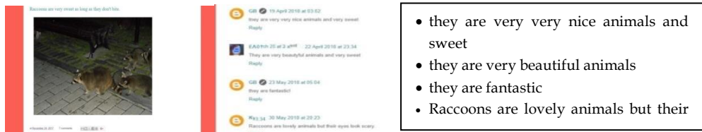
Εικόνα 3 α, β. Είδη σχολίων σε ανάρτηση

Σε περιπτώσεις απονίας ή δυσφορίας, οι παροτρύνσεις της εκπαιδευτικού εμπλοτύζαν την παραγωγικότητα. Η συνειδητοποίηση της άμεσης έκθεσης καλλιεργούσε υπευθυνότητα τόσο για όψη όσο και για ουσία περιεχομένου. Η ανατροφοδότηση από τρίτα πρόσωπα (μαθητές και εκπαιδευτικοί εκτός τάξης ή σχολείου) υποδήλωνε έγκυρη πληροφόρηση και κλιμάκωση της αυτοπεποίθησης συνδρομητών. Τα σχόλια - πέραν της γλωσσικής εξάσκησης - απέδιδαν κοινωνικά μέσω προβληματισμού, ανάπτυξης διαδίκτυακής αγωγής, ενθάρρυνσης συνομηλίκων, εξωτερικευσης, απόκρισης σε ερωτήσεις (Εικόνα 3 α, β). Η συμμόρφωση με κανόνες ψηφιακής συμπεριφοράς στάθηκε άμογη. Ουδέποτε τέθηκαν θέματα παραβίασης ορίων.