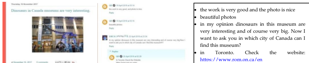
Εικόνα 2 α, β. Παραδείγματα αντίδρασης ιστολογούντων μαθητών

Παράλληλα, οι χρήστες απαντούσαν σε ερωτήσεις αναγνωστών-δασκάλων ή και συνομηλικών ξένων μονάδων (οι οποίοι είχαν ενημερωθεί να προβούν σε επισκόπηση του ιστολογίου) και ευχαριστούσαν (Εικόνα 2 α, β). Κάποια στιγμή ξεκίνησε συναγωνισμός μεταξύ των ιστολογούντων μαθητών (bloggers) για κατάκτηση αριθμού επισημάνσεων.