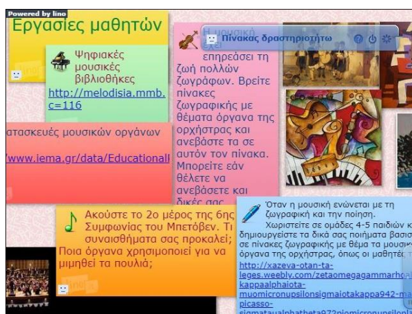
Εικόνα 4. Πίνακας Δραστηριοτήτων του Δικτυότοπου