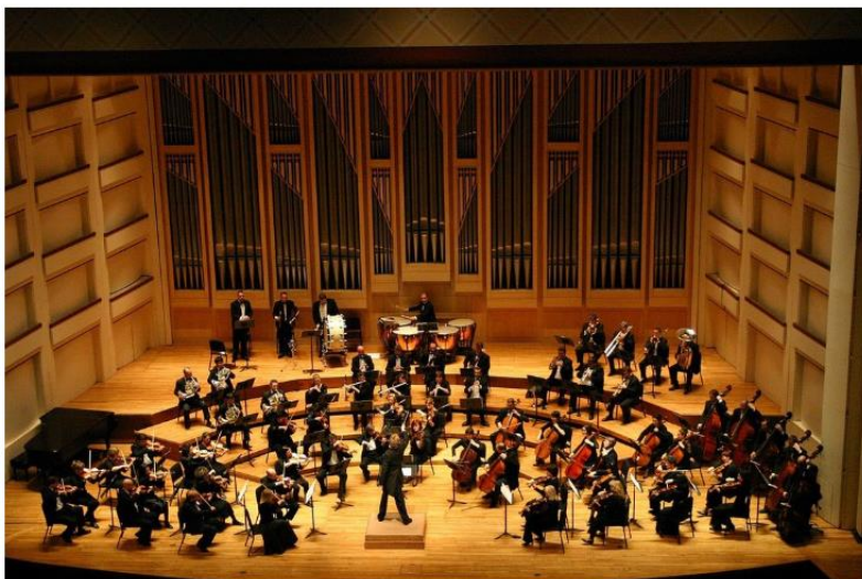
Εικόνα 2. Δικτυότοπος Ψηφιακού Σεναρίου

Σε μια εποχή που οι ΤΠΕ αποτελούν σημαντικό κομμάτι της καθημερινότητάς τους (Δουληγέρης κ.ά., 2017), είναι ελκυστικό οι μαθητές να μπορούν να ενημερώνονται μέσω του διαδικτύου με στοιχεία και πληροφορίες γύρω από αντικείμενα του μαθήματος. Η χρήση της δεν προαπαιτεί κάποια ιδιαίτερη γνώση πέραν του βασικού ψηφιακού αλφαριθμητισμού: πώς ανοίγουμε έναν περιηγητή, πώς συνδεόμαστε σε ένα λογαριασμό κ.λπ. Στο πρωτοέλιδο του δικτυότοπου («Αρχική») παρουσιάζεται στον μαθητή μία εισαγωγή στο θέμα. Επίσης δίνεται η δυνατότητα στους χρήστες να επιστρέψουν στην αρχική σελίδα κατά την πλοήγηση. Επιπλέον πλεονέκτημα αποτελεί το γεγονός ότι οι μαθητές έχουν τη δυνατότητα να χρησιμοποιήσουν ελκυστικά προγράμματα διάδρασης, κατανόησης, εμπέδωσης, αυτοαξιολόγησης και μεταγνώσης σχετικά με τη Συμφωνική Ορχήστρα και τις επιμέρους ομάδες των οργάνων. Ο δικτυότοπος «παρέχει στο δάσκαλο ένα εργαλείο ευρύτερης αξιολόγησης αλλά και στο μαθητή ένα έναυσμα συμμετοχής σε ομάδες και συνεργασίες» (Νικολαΐδου, 2002), αξιοποιώντας λογισμικά ανοιχτού κώδικα, σχετικά εύκολης χρήσης. Σχετικά με τις κατευθύνσεις του σεναρίου υπάρχουν εμπλουτισμένα ηλεκτρονικά βιβλία μαθητή όπως παρέχονται από το Υπουργείο Παιδείας (Φωτόδεντρο), δικτυότοποι όπως η