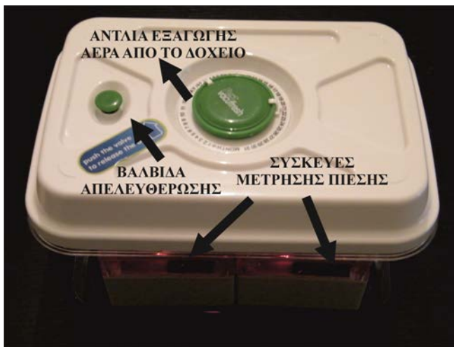
Σχήμα 2. Αεροστεγές δοχείο που χρησιμοποιείται στα πειράματα

Ένα επιπλέον πείραμα που υλοποιήθηκε από την εκμετάλλευση της σύγχρονης ψηφιακής τεχνολογίας της ασύρματης ζεύξης, ήταν η εξέταση της απόκλισης των δύο συσκευών για τη μέτρηση της ίδιας τιμής πίεσης στις ίδιες περιβαλλοντικές συνθήκες. Για το πείραμα αυτό χρησιμοποιήθηκε το αεροστεγές δοχείο που παρουσιάζεται στο Σχήμα 2. Το δοχείο αυτό έχει τη δυνατότητα εξαγωγής του αέρα με τη χρήση αντλίας και συνεπώς, επιτρέπει την εξέταση της απόκλισης των δύο αισθητήρων σε διαφορετικά επίπεδα πίεσης. Επιπλέον, εντός του δοχείου δεν υπάρχουν μεταβολές της πίεσης από καιρικά φαινόμενα και μπορούμε να θεωρήσουμε ότι οι δύο αισθητήρες βρίσκονται στις ίδιες συνθήκες υγρασίας και θερμοκρασίας. Όπως είναι κατανοητό, η χρήση της ασύρματης τεχνολογίας κατέστησε κανή τη διεξαγωγή ενός πειράματος που απαιτεί ιδιαίτερα ακριβό εξοπλισμό (ελεγκτή πίεσης, ειδικό δοχείο κλπ).