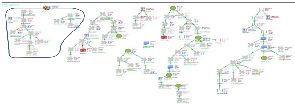
Σχήμα 1. Αποτύπωση στο CoI Code του 1 ο σταδίου διεπιστημονικής συνεργασίας της κοινότητας σχεδιασμού του c-book unit με θέμα «Κλιματική Αλλαγή». Συνολική διάρκεια 25/3-23/4/15

«Θα μπορούσα να πω ότι το πρώτο στάδιο ήταν της ανεύρεσης πληροφοριών. Όλοι προσπαθήσαμε να καταλάβουμε τι είναι αυτό ακόμη και εμείς του ίδιου αντικειμένου διαβάσαμε και μελετήσαμε γύρω από την Κλιματική Αλλαγή και να βρούμε και πιο πρόσφατες πηγές. Οπότε το πρώτο στάδιο ήταν κυρίως της εύρεσης πληροφοριών, συλλογής πληροφοριών» (ΦΙ-ΠΕ-Β)