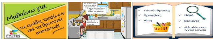
Σχήμα 3. Η εικονική κουζίνα που δημιουργήθηκε