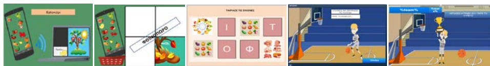
Σχήμα 10. Παραδείγματα εκπαιδευτικών παιχνιδιών που δημιουργήθηκαν