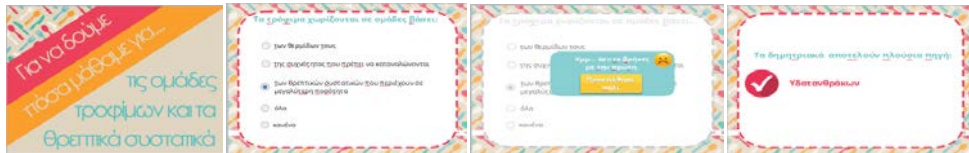
Σχήμα 9. Παραδείγματα ερωτήσεων κατανόησης

Δημιουργήθηκαν διαφορετικού τύπου ερωτήσεις, όπως αντιστοίχισης, πολλαπλών επιλογών, βρες την σωστή απάντηση και ένωση τις προτάσεις οι οποίες εμφανίζονταν κάθε φορά με τυχαία σειρά. Ο μαθητής είχε την δυνατότητα να προσπαθήσει δύο φορές. Αν, την έβρισκε, εμφανιζόταν ένα μήνυμα που του έγραφε «Μπράβο συνέχισε» ενώ, σε περίπτωση που δεν απαντούσε σωστά, ένα μήνυμα του έλεγε «προσπάθησε ξανά» ή «λάθος απάντηση, δες την σωστή. Η αξιολόγηση της επαναληπτικής ενότητας, έγινε μέσα από ένα παιχνίδι. Οι μαθητές κάθε φορά που απαντούσαν σωστά στην ερώτηση η μπάλα έμπαινε στο καλάθι, ενώ σε αντίθετη περίπτωση η μπάλα έβγαινε έξω. Στο τέλος, αν απαντούσαν σωστά επτά από τις δέκα ερωτήσεις έπαιρναν ένα εικονικό κύπελλο.