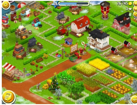
Σχήμα 2. Το περιβάλλον του παιχνιδιού Hay Day

δεξιότητες οργάνωσης από τον ισότοπο http://learningworksforkids.com/ . Το παιχνίδι παίζεται σε ηλεκτρονική ταμπλέτα και κινητό νέας γενιάς.