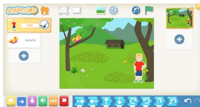
Σχήμα 5. Σκηνή προβλήματος αξιολόγησης (Γαλλία)

Ένα παιδί κινείται μέχρι να φτάσει στο κέντρο του κύκλου στα αριστερά του. Μόλις το παιδί φτάσει στο εσωτερικό του κύκλου, η πεταλούδα ξεκινάει να κατεβαίνει μέχρι να ακουμπήσει στο χορτάρι που βρίσκεται κάτω από το δέντρο.