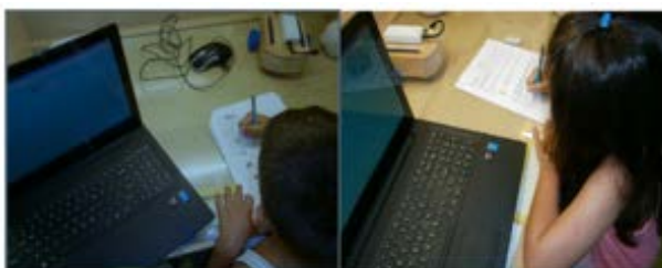
Σχήμα 2. Εργασία μαθητών στο φύλλο δραστηριοτήτων

Το πρώτο ερευνητικό πρωτόκολλο αφορά την καταγραφή των γνωστικών αναπαραστάσεων καθώς και των ιδεών των παιδιών για το προγραμματιζόμενο ρομπότ (Σχήμα 3). Κύρια επιδίωξη ήταν η διερεύνηση των ιδεών των μαθητών γύρω από τη διεπιφάνεια χρήσης της ρομποτικής κατασκευής/ προγραμματιζόμενου ρομπότ.