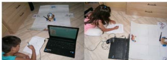
Σχήμα 4. Ο τρόπος εργασίας των μαθητών

Στο επόμενο στάδιο τα παιδιά κλήθηκαν να δημιουργήσουν τα πρώτα ολοκληρωμένα προγράμματα με το ρομπότ (Σχήμα 5). Για το σκοπό αυτό χρησιμοποιήθηκε δάπεδο μετακίνησης με αντικείμενα επάνω του. Η πρώτη διαδρομή ζητούσε από τα παιδιά να κατευθύνουν το ρομπότ να κινηθεί μπροστά ώστε να φτάσει σε ένα παγκάκι (2 βήματα). Τα περισσότερα παιδιά ανταποκρίθηκαν πολύ εύκολα. Κάποια παιδιά κατά τη δημιουργία του προγράμματος πάτησαν το κουμπί «μπροστά» μόνο μια φορά. Αμέσως αντιλήφθηκαν το σφάλμα τους και έλυσαν το πρόβλημα βάζοντας τα σωστά βήματα.