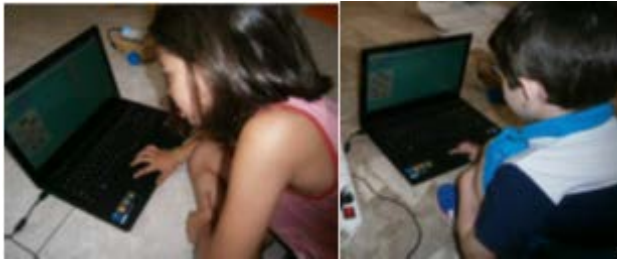
Σχήμα 3. Οι μαθητές πειραματίζονται

Αμέσως μετά απάντησαν σε κατάλληλες ερωτήσεις για το εάν αντιλήφθηκαν τη σημασία των κουμπιών και ποια ήταν η χρησιμότητά τους. Μέσα από τις απαντήσεις των παιδιών διαπιστώσαμε ότι έχουν καταλάβει το ρόλο του κάθε πλήκτρου χωρίς να χρειαστεί να εξηγηθεί κάποιο από αυτά.