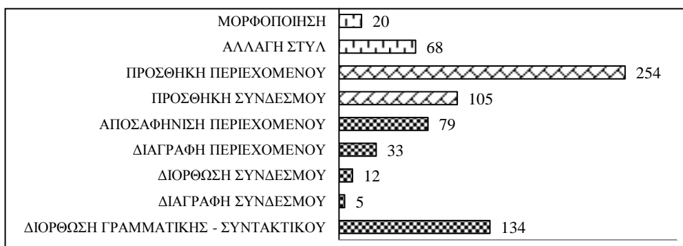
Γράφημα 2: Πλήθος ενεργειών ανά κατηγορία

Βαθμός συνεργασίας. Στις 16 αρχικές σελίδες των σεναρίων των ομάδων καταγράφηκαν 710 ενέργειες, οι οποίες φαίνονται στο γράφημα 2. Οι τρεις ενέργειες που κυριάρχησαν ήταν η προσθήκη περιεχομένου, η διόρθωση γραμματικής ή συντακτικού και η προσθήκη συνδέσμου.