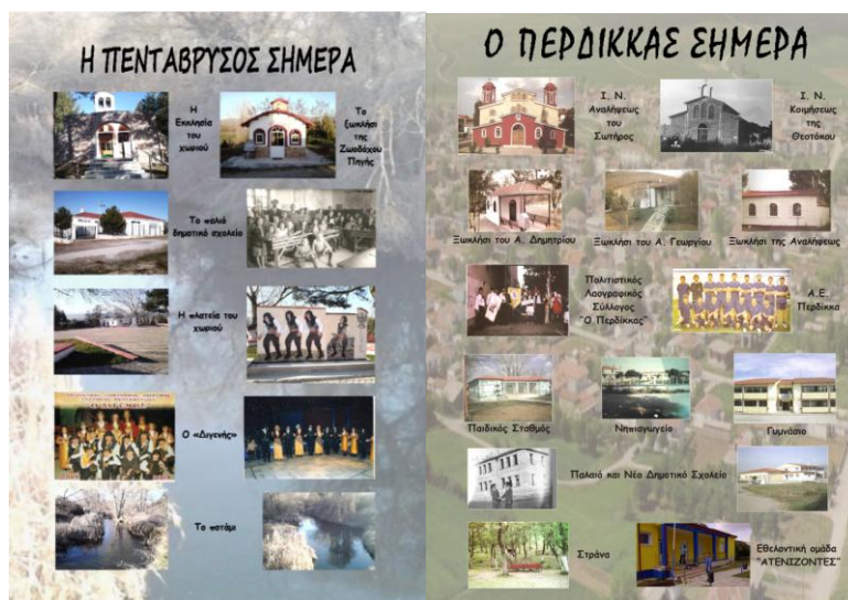
Εικόνα 1: Αφίσες των παιδιών για τα δύο χωριά.

χάρτες, για να αποτυπώσουν και να παρουσιάσουν με πλούσιο εποπτικό υλικό και μικρά συνοδευτικά κείμενα την ιστορική γνώση που κατέκτησαν κατά την έρευνα και τη συγγραφή της εργασίας. Για τη δημιουργία των παρουσιάσεων, των χαρτών και των αφισών οι μαθητές χρησιμοποίησαν τα εργαλεία του λογισμικού Microsoft Office PowerPoint και της διαδικτυακής υπηρεσίας Google Maps.