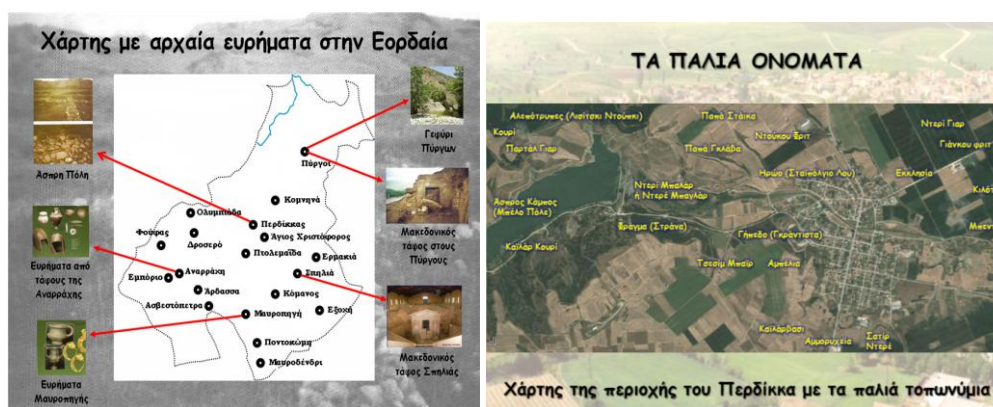
Εικόνα 2: Προτότυποι χάρτες των μαθητών για την τοπική ιστορία.

Σ' αυτή τη δημιουργική δραστηριότητα οι μαθητές αξιοποίησαν το ψηφιοποιημένο και αρχειοθετημένο υλικό, κάτι που τους βοήθησε να εργαστούν πιο γρήγορα και εύκολα. Ο ρόλος του καθηγητή ήταν ελάχιστα παρεμβατικός και περισσότερο καθοδηγητικός, για να επιλύσει κάποιο τεχνικό πρόβλημα, να ενθαρρύνει τα παιδιά ή να παρακινήσει ορισμένους μαθητές που δε συμμετείχαν ενεργά. Στις περισσότερες περιπτώσεις τα μέλη της ομάδας αλληλοβοηθούνταν μεταξύ τους ή ζητούσαν βοήθεια από άλλη ομάδα για απορίες ή τεχνικές δυσκολίες που αντιμετώπιζαν.