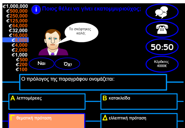
Εικόνα 6: Το παιχνίδι συμπεριφοριστικού τύπου "Ποιος θέλει να γίνει εκατομμυριούχος"

Η παραπομπή στο ΛΚΝ αποτελεί μια έμμεση σύνδεση των ΤΠΕ με τις γνώσεις για τη γλώσσα. Ένας περισσότερο ρητός τρόπος σύνδεσης είναι η περίπτωση του εκπαιδευτικού παιχνιδιού «Ποιος θέλει να γίνει εκατομμυριούχος». Πρόκειται για ένα κλειστό λογισμικό που τίθεται εκτός της μακροδομής της διδασκτικής ενότητας στο εισαγωγικό μέρος. Το περιβάλλον αυτό, που φέρει τη δομή του οικείου τηλεοπτικού παιχνιδιού (Εικόνα 6), προωθεί το σχήμα της ερώτησης-απάντησης-αξιολόγησης με στόχο την εξάσκηση των λεξικογραμματικών γνώσεων των μαθητών. Πρόκειται για ένα κλειστό λογισμικό δομικού και συμπεριφοριστικού χαρακτήρα που αντιλαμβάνεται τη σύνδεση των ΤΠΕ με τις γνώσεις για τη γλώσσα εντελώς εργαλειακά στα πλαίσια των οπτικών του Α΄ κύκλου (βλ. 2.1).