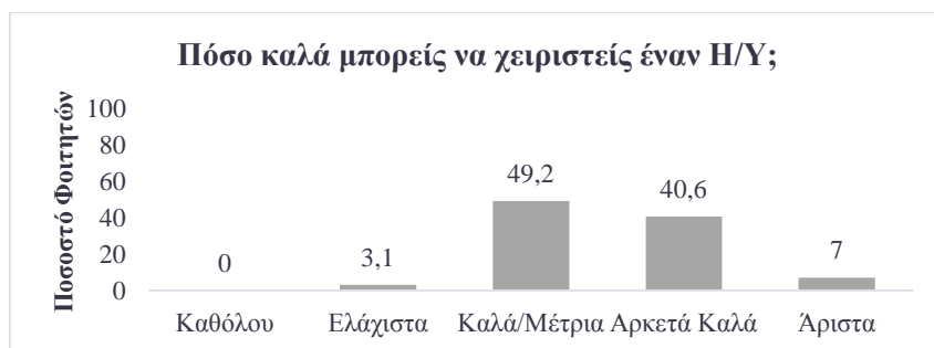
Γράφημα 2: Αυτοαξιολόγηση φοιτητών.