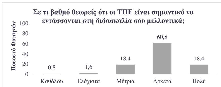
Γράφημα 3: Απόψεις για τη σημασία ενσωμάτωσης των ΤΠΕ.

Όσον αφορά τη σημασία που αποδίδουν οι φοιτητές στην ενσωμάτωση των ΤΠΕ στη διδασκαλία, σχεδόν το σύνολο των συμμετεχόντων (97,62%) θεωρεί ότι οι ΤΠΕ πρέπει να ενσωματώνονται στην εκπαίδευση. Μάλιστα, περίπου το 60% των συμμετεχόντων θεωρεί αρκετά σημαντική αυτή την ενσωμάτωση, όπως φαίνεται στο Γράφημα 3 που ακολουθεί.