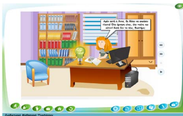
Εικ. 1: Οθόνη από το περιβάλλον της Παρουσίασης των φαινομένων

Το τμήμα των «Δραστηριοτήτων» δίνει τη δυνατότητα στο μαθητή να ασκηθεί στα γλωσσικά φαινόμενα μέσα από πλήθος ασκήσεων. Στο σημείο αυτό το Ηλεκτρονικό Περιβάλλον αξιοποιείται ως φροντιστηριακό εργαλείο . Η επιλογή αυτή, όπως προαναφέρθηκε και στο πρώτο μέρος του άρθρου, στηρίζεται στο γεγονός ότι παρά τα χαμηλά επίπεδα αλληλεπιδραστικότητας και την περιορισμένη ικανότητα κατασκευής νοήματος, οι ασκήσεις έχουν θετικά αποτελέσματα στη μάθηση της γραμματικής κυρίως για τα υψηλότερα επίπεδα