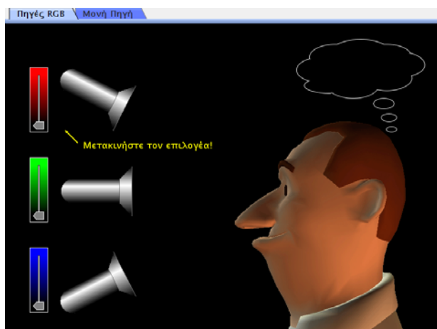
Εικόνα 2. Η προσομοίωση PhET «Διάθλαση του Φωτός» στην ενότητα «Έγχρωμη όραση» (δεύτερο φύλλο εργασίας).

Στο τρίτο φύλλο εργασίας οι μαθητές καλούνται να αλληλεπιδράσουν με προσομοίωση PhET για να δοκιμάσουν διάφορα φίλτρα (Εικόνα 3) και φακούς, να παρατηρήσουν τα χρώματα που θα βλέπει ο άνθρωπος του λογισμικού και να ερμηνεύσουν το αποτέλεσμα.