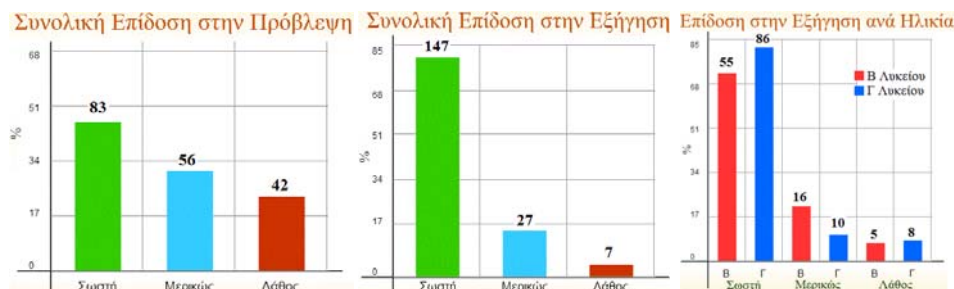
Διάγραμμα 1. Συνολική επίδοση στην πρόβλεψη (α), στην εξήγηση (β) και ανά ηλικία (γ)

ηλικίας. Αν και οι μαθητές της Γ' Λυκείου επέτυχαν υψηλότερη επίδοση στην Πρόβλεψη, εντούτοις στην Εξήγηση και στο Συμπέρασμα οι μικρότεροι συμμαθητές τους (που δεν είχαν διδαχτεί το φαινόμενο στο σχολείο) επέτυχαν παρόμοιες με αυτούς επιδόσεις.