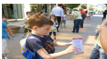
Εικόνα 2. Το ιστολόγιο: «Αγαπημένο μου ιστολόγιο...»