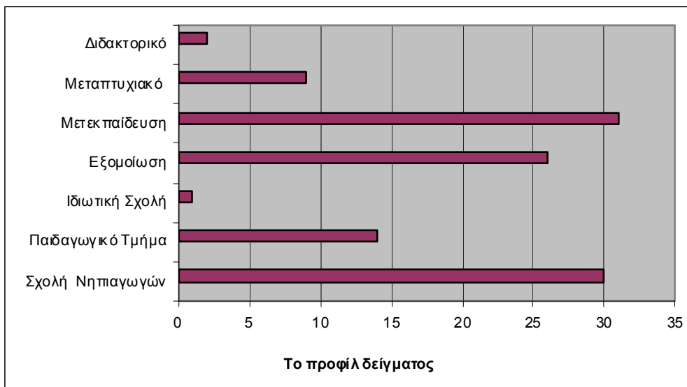
Σχήμα 1. Το προφίλ του δείγματος της έρευνας

Πληθυσμό της έρευνας αποτέλεσαν άνδρες και γυναίκες εκπαιδευτικοί δημοσίων και ιδιωτικών νηπιαγωγείων της Κρήτης. Το δείγμα της παρούσας έρευνας ήταν 45 νηπιαγωγοί (n=45). Μέσο συλλογής δεδομένων ήταν η ημιδομημένη συνέντευξη και πραγματοποιήθηκε ανάλυση περιεχομένου (Βάμβουκας, 2007). Ο μέσος όρος προϋπηρεσίας των νηπιαγωγών, ήταν 15 χρόνια. Στο προφίλ των νηπιαγωγών εκτός από τη βασική εκπαίδευση περιλαμβάνονταν και μεταπτυχιακές σπουδές. Πιο συγκεκριμένα, όπως φαίνεται στο σχήμα 1, από το σύνολο του δείγματος τριάντα (30) είχαν πτυχίο Σχολής Νηπιαγωγών, είκοσι έξι (26) είχαν κάνει εξομοίωση, ενώ δεκατέσσερις (14) ήταν πτυχιούχοι Δημόσιων Παιδαγωγικών Τμημάτων και ένας (1) Ιδιωτικής Σχολής. Μετεκπαίδευση είχαν κάνει οι τριανταένα (31), και κατείχαν μεταπτυχιακό και διδακτορικό τίτλο σπουδών εννιά (9) και δύο (2) εκπαιδευτικοί αντίστοιχα.