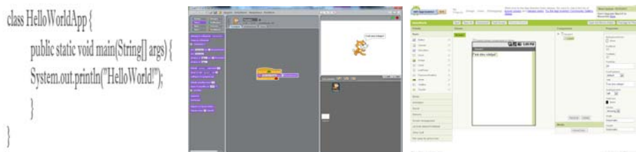
Σχήμα 1. Διαφορά σύνταξης προγράμματος σε Java, Scratch & AppInventor