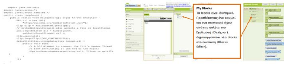
Σχήμα 3. Η διαφορά στη δημιουργία μιας εφαρμογής σε Java & eclipse και σε AI

ανάπτυξης λογισμικού (π.χ. Eclipse, Android SDK κ.ά.). Το AI, αντίθετα, υιοθετεί το επιτυχημένο παράδειγμα της χρήσης του οπτικού προγραμματισμού με πλακίδια (π.χ. Scratch), προσαρμόζοντάς το στον προγραμματισμό έξυπνων κινητών συσκευών (π.χ. smartphones) (Gray et al., 2012). Η εφημερίδα New York Times αποκάλυψε το AI ως «Do-it-yourself App Creation Software» (Wolber, 2010). Το περιβάλλον ανάπτυξης του AI υποστηρίζει και τα τρία δημοφιλή λειτουργικά συστήματα. Στο σχήμα 3 παρουσιάζεται η διαφορά στη δημιουργία μιας φορητής εφαρμογής αναπαραγωγής ήχου σε Java και στο AI.