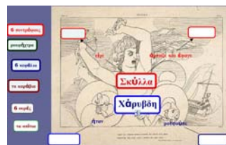
Εικόνα 6: Νοηματικός χάρτης