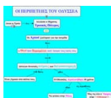
Εικόνα 4: Εννοιολογικός χάρτης

Η συλλογή των δεδομένων έγινε μέσω παρατήρησης και δοκιμασιών, γραπτών και προφορικών. Επίσης η μαθήτριά εξέφρασε την άποψή της για τους εννοιολογικούς χάρτες στον Η/Υ σε μία συζήτηση που πραγματοποιήθηκε στο τέλος.