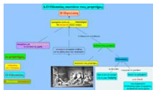
Εικόνα 2: Ημιτελής Εννοιολογικός χάρτης «Ο Οδυσσεύς σκοτώνει τους μνηστήρες»