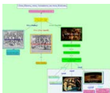
Εικόνα 1: Εννοιολογικός Χάρτης «Στους Κίκονες και τους Λωτοφάγους»

α) Στα πρώτα τρία μαθήματα έγινε μία άμεση κλασική διδασκαλία, που περιελάμβανε αφήγηση, νοηματική, ιστορική και γλωσσική ανάλυση, ερωτήσεις-απαντήσεις, χρήση των εικόνων ως πηγών, Video, χωρίς τη χρήση των εννοιολογικών χαρτών, β) Στο τέταρτο και πέμπτο μάθημα, χρησιμοποιήθηκαν οι εννοιολογικοί χάρτες, σε συνδυασμό με αλληλεπιδραστικές μορφές διδασκαλίας, στο τέλος της διδασκαλίας ως εργαλεία εμπέδωσης και αξιολόγησης και παρέχονταν παράλληλα στο μαθητή, για το σπίτι, ακουστικό υλικό με ηχογραφημένη την αφήγηση των μαθημάτων, γ) Στο έκτο και έβδομο μάθημα, παράλληλα με το βιβλίο, χρησιμοποιήθηκαν πολυμεσικοί εννοιολογικοί χάρτες στην αρχή ως προκαταβολικοί οργανωτές και στο τέλος της διδασκαλίας, σε συνδυασμό με αλληλεπιδραστικές μορφές διδασκαλίας. Επίσης παρέχονταν ακουστικό υλικό του μαθήματος τόσο στο σχολείο όσο και στο σπίτι, δ) Στο όγδοο μάθημα, στο ένατο και στο δέκατο μάθημα, χρησιμοποιήθηκαν μόνο οι πολυμεσικοί εννοιολογικοί χάρτες καθ' όλη τη διάρκεια της διδασκαλίας χωρίς τη χρήση του βιβλίου. Η ανάλυση των σημασιολογικών χαρακτηριστικών γινόταν μόνο από το χάρτη με τη βοήθεια των οπτικοακουστικών μέσων του και ο μαθητής στο σπίτι του έπαιρνε μόνο τους χάρτες και ηχογραφημένη την αφήγηση του μαθήματος.