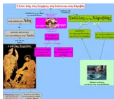
Εικόνα 5: Εννοιολογικός χάρτης

«Οι Περιπέτειες του Οδυσσέα» «Στον Άδη στις Σειρήνες, στη Σκύλλα και Χάρυβδη»