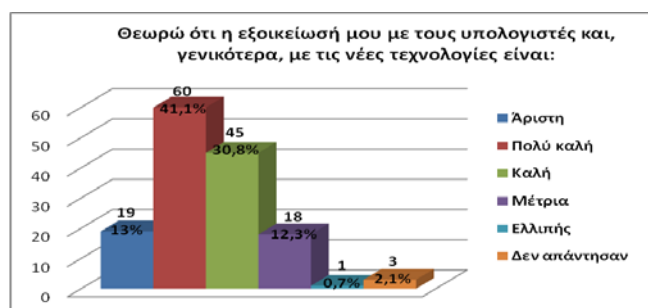
Σχήμα 1: Ραβδόγραμμα συχνοτήτων της κατανομής των 146 καθηγητών ως προς την πεποίθησή τους σχετικά με την εξοικείωσή τους με τις ΤΠΕ.

υπολογιστές και τις νέες τεχνολογίες, το 30,8% «καλή», ενώ μόλις το 13% των καθηγητών δήλωσε πως οι γνώσεις του στις ΤΠΕ είναι από «μέτρια» έως «ελλιπής» (σχήμα 1). Αυτό σημαίνει ότι οι στάσεις της πλειονότητας των εκπαιδευτικών του δείγματός μας απέναντι στους υπολογιστές και στις νέες τεχνολογίες είναι ιδιαίτερος θετικές, γεγονός που υποδηλώνει ότι οι περισσότεροι καθηγητές αισθάνονται αυτεπάρκεια (self-efficacy) και εμπιστοσύνη στις ικανότητες τους χρήσης των ΤΠΕ και όχι φόβο ή επιφυλακτικότητα (anxiety) (Τζιμογιάννης & Κόμης, 2004). Τα επίπεδα εξοικείωσης με τις ΤΠΕ που δήλωσαν οι καθηγητές της έρευνάς μας είναι σαφώς υψηλότερα από εκείνα που ανιχνεύτηκαν στην έρευνα των Paradia et al. (2011), όπου μόλις το 37,5% των φιλόλογων δήλωσε ότι η εξοικείωσή του με τις νέες τεχνολογίες και το διαδίκτυο είναι από καλή έως υψηλή.