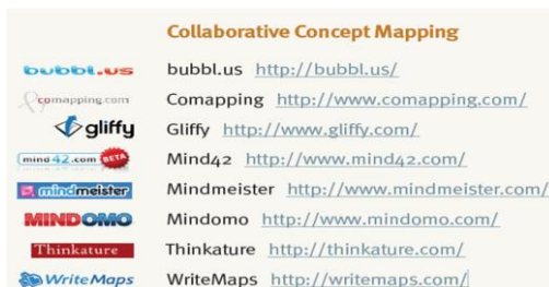
Σχήμα 2: Συνεργατική εννοιολογική χαρτογράφηση και Τ.Π.Ε. (Deal, 2009)

Στο Σχήμα 2 παρατίθενται κάποια άλλα εργαλεία συνεργατικής εννοιολογικής χαρτογράφησης.