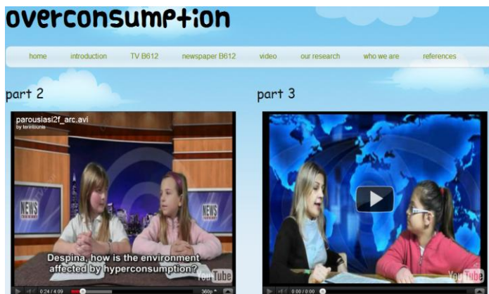
Εικόνα 1. Συνεντεύξεις με ειδικούς.

εργασίες και τα καθήκοντα ενώ ταυτόχρονα πώς να συνδέουν τις πληροφορίες και τα αποτελέσματα της έρευνας ως μια ενιαία εργασία. Κατανόησαν πώς πρέπει να παρουσιάζουν μια πληροφορία όταν πρόκειται να την εκφράσουν προφορικά ή γραπτά. Συνειδητοποίησαν τις δυνατότητες που παρέχει μια ιστοσελίδα και τους διάφορους τρόπους με τους οποίους μπορεί κανείς να μεταδώσει μια πληροφορία. Η μελέτη όλων των πηγών, η διεξαγωγή έρευνας με χρήση ερωτηματολογίων και οι συνεντεύξεις τους έδωσαν να καταλάβουν πόσο σημαντικό είναι το πρόβλημα της υπερκατανάλωσης αγαθών. Κατανόησαν τις βαθύτερες αιτίες του και τους έκανε να αλλάξουν συνήθειες και νοοτροπίες.