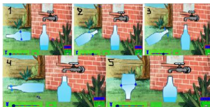
Σχήμα 4: Η επίδοση στο ΕΣΥ του Ν. σε 5 εικόνες

Στο σχήμα 4 φαίνεται η επίδοση του δεύτερου παιδιού, του Ν.