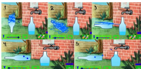
Σχήμα 5: Η επίδοση στα ΕΣΥ του Κ. σε 5 εικόνες

2 η ομάδα: εμπλοκή αρχικά με την δεύτερη και κατόπιν με την πρώτη προσομοίωση : Στη δεύτερη ομάδα παρουσιάζονται τα αποτελέσματα δύο παιδιών που ενεπλάκησαν και στις δυο προσομοιώσεις. Στο σχήμα 5 φαίνεται η επίδοση του Κ.