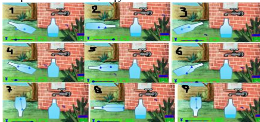
Σχήμα 3: Η επίδοση στο ΕΣΥ της Κ. σε 9 εικόνες

1 η ομάδα: ενεπλάκη μόνο με την πρώτη προσομοίωση : Στη πρώτη ομάδα παρουσιάζονται τα αποτελέσματα δυο παιδιών που απλά σχεδίασαν την ελαστική γραμμή. Στο Σχήμα 3 φαίνεται η επίδοση του πρώτου παιδιού, της Κ.