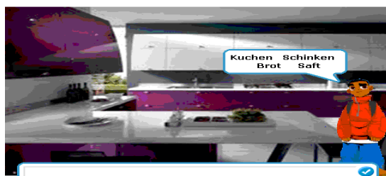
Εικόνα 2. Διαδραστική άσκηση εμπέδωσης λεξιλογίου

και πιστοποιεί κατά συνέπεια την δεξιότητα της κατανόησης του γραπτού λόγου. Η διαδικασία αυτή συντελείται μέσω των απαντήσεων στις ασκήσεις που έπονται της παρουσίασης του λεξιλογίου των δύο θεματικών ενότητων. Οι απαντήσεις καλύπτονται μέσω της αναπαραγωγής του γραπτού λόγου (Bohm, 2003; Α.Π.Σ., 2006), καθώς τα παιδιά καλούνται να επιλέξουν την σωστή λύση από το σύνολο των λέξεων που τους δίνεται. Γι' αυτόν τον λόγο οι εν λόγω δραστηριότητες δεν εντάσσονται στη παραγωγή γραπτού λόγου, παρόλο που συμπληρώνονται με γραπτό τρόπο.