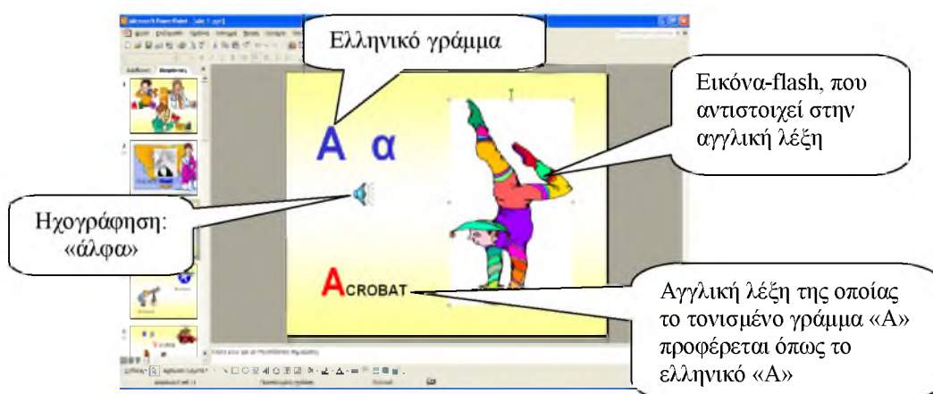
Εικόνα 1: Παρουσίαση με χρήση πολυμέσων του Ελληνικού αλφάβητου

Το επόμενο βήμα ήταν να αναδειχθεί περαιτέρω συμμετοχή και η συμβολή της ελληνικής γλώσσας στη δημιουργία των ευρωπαϊκών γλωσσών και με αυτό τον τρόπο να αναγνωρίσουν τα παιδιά την πολιτιστική της αξία. Αναζητήθηκαν στο διαδίκτυο αγγλικές λέξεις με ελληνικές ρίζες. Τα αποτελέσματα της αναζήτησης ήταν μια πλούσια μαθησιακή εμπειρία για την επίδραση της ελληνικής γλώσσας στο ευρωπαϊκό λεξιλόγιο και την διεθνή ορολογία. Τα αποτελέσματα της αναζήτησης οργανώθηκαν σε μια καλαίσθητη παρουσίαση Power Point, δημοσιεύθηκαν, τυπώθηκαν και αναρτήθηκαν σε πίνακα ανακοινώσεων του σχολείου, δημιουργώντας έναυσμα συζήτησης και για τους μαθητές που δεν συμμετείχαν στο έργο και στο πρόγραμμα.