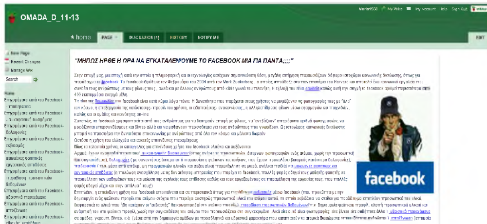
Εικόνα 2: Στιγμιότυπο από εργασία ομάδας

ο οποίος ήταν υπεύθυνος να οργανώσει το υλικό που θα είχε συλλέξει ο συλλέκτης, να ελέγξει τη συνάφειά του με τους στόχους του σεναρίου και να το αξιολογήσει. Ο «Συντάκτης» ήταν υπεύθυνος να συγγράψει το κείμενο με βάση τους στόχους του σεναρίου. Ο «Αρχισυντάκτης», είχε την υποχρέωση να αναρτήσει στο wiki το κείμενο που θα είχε γράψει ο Συντάκτης και να αναρτήσει σε αυτό το υλικό που θα είχε συγκεντρώσει ο Συλλέκτης. Τελευταίος ήταν ο ρόλος του «Ελεγκτή», ο οποίος ήταν υπεύθυνος να ελέγξει το περιεχόμενο της εργασίας ως προς την πληρότητά του, τη δομή του, τη συνέπειά του σε συνάρτηση με τους στόχους της εργασίας, τη συνοχή και την καταλληλότητα του πρόσθετου υλικού.