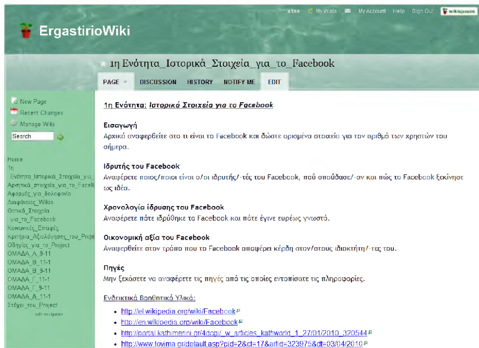
Εικόνα 1: Στιγμιότυπο του προτεινόμενου προτύπου μορφοποίησης του wiki που παρουσιάστηκε στους συμμετέχοντες

Το μαθησιακό όφελος των φοιτητών αναμενόταν να επιτευχθεί μέσα από 4 παράγοντες: την αναζήτηση πληροφοριών, την ανάπτυξη επιχειρημάτων για τα ζητούμενα της εργασίας, τη συνεργασία μεταξύ των μελών καθώς και την ενασχόλησή τους με το εργαλείο wiki. Η διαδικασία που ακολουθήθηκε ήταν η εξής: Αρχικά, σε εργαστηριακή συνεδρία του μαθήματος, πραγματοποιήθηκε διδασκαλία για τις βασικές έννοιες των wikis και παρουσιάστηκαν στους φοιτητές προσεγγίσεις αξιοποίησης του στην εκπαίδευση. Στη συνέχεια, επιδιώχθηκε η εξοικείωση των φοιτητών με το εργαλείο wiki και εξάσκηση με τις βασικές εφαρμογές του, όπως ανάρτηση κειμένου, σχολιασμός κειμένου, ανάρτηση φωτογραφιών και βίντεο, κτλ.