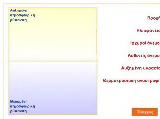
Εικόνα 1: Στιγμιότυπο από την εφαρμογή για τη συσχέτιση μετεωρολογικών παραμέτρων με την ατμοσφαιρική ρύπανση

Η 1η δραστηριότητα βασίζεται σε μια πρωτότυπη αλληλεπιδραστική εφαρμογή λογισμικού (εικ. 1), με την οποία ζητείται η ταξινόμηση ορισμένων μετεωρολογικών παραμέτρων ανάλογα με το βαθμό συμβολής τους στη συγκέντρωση ατμοσφαιρικών ρύπων. Η συγκεκριμένη εφαρμογή δημιουργήθηκε με βάση τα εξής κριτήρια: α) μπορεί να λειτουργήσει ως αφετηρία προβληματισμού β) χρησιμεύει στη διατύπωση υποθέσεων γ) έχει τη δυνατότητα ανατροφοδότησης μέσω του ελέγχου των απαντήσεων δ) οδηγεί στη διαπίστωση της ανάγκης πειραματισμού.