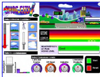
Εικόνα 6: Η γενική μορφή του λογισμικού smogcity για το φωτοχημικό νέφος

Η συγκεκριμένη εφαρμογή επιλέχθηκε με βάση τα εξής κριτήρια: α) αναφέρεται σε αστικό περιβάλλον και δίνει ευκαιρίες για αναφορά στο ρόλο των πολιτών β) συνδυάζει μετεωρολογικές παραμέτρους και εκπομπές ατμοσφαιρικών ρύπων από διάφορες πηγές γ) δίνει την ευκαιρία για ιδιαίτερη αναφορά στο φωτοχημικό νέφος και για διάκρισή του από το νέφος αιθαλομίχλης, δυο διαφορετικές μορφές τοπικής ατμοσφαιρικής ρύπανσης δ) κάνει αναφορά στην κατηγοριοποίηση των επιπέδων ρύπανσης και στις αντίστοιχες συνέπειες στην ανθρώπινη υγεία ε) παρέχει τη δυνατότητα ελέγχου υποθέσεων μέσω του συνυπολογισμού παραμέτρων στ) το μοντέλο που υποστηρίζει την εφαρμογή, έχει προκύψει από επεξεργασία δεδομένων από μακροχρόνιες παρατηρήσεις.