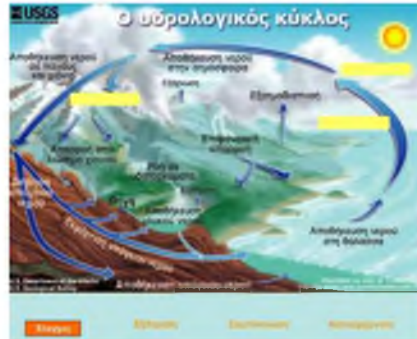
Εικόνα 3: Η εφαρμογή για τον υδρολογικό κύκλο

Η συγκεκριμένη εφαρμογή δημιουργήθηκε με βάση τα εξής κριτήρια: α) μπορεί να λειτουργήσει ως αφετηρία προβληματισμού στο θέμα των κατακόρυφων κινήσεων του αέρα β) χρησιμεύει στη διατύπωση υποθέσεων για την περίπτωση που εμποδίζονται οι ανοδικές κινήσεις του αέρα γ) έχει τη δυνατότητα ανατροφοδότησης μέσω του ελέγχου των απαντήσεων δ) οδηγεί στη διαπίστωση της ανάγκης πειραματισμού.