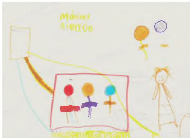
Εικόνα 2: Τελικό σχέδιο υπολογιστή Υποκειμένου 1

Από τις δύο ομαδικές κατασκευές που δημιούργησαν τα παιδιά σε δύο ομάδες των τριών ατόμων, λαμβάνονται επίσης ενθαρρυντικά αποτελέσματα σχετικά με την κατασκευή όλων των περιφερειακών συσκευών. Πιο αναλυτικά, και οι δύο ομάδες συμπεριέλαβαν στην κατασκευή του υπολογιστή όλες τις περιφερειακές συσκευές μαζί με τα καλώδια που αυτές διαθέτουν αλλά και τις συνέδεσαν ορθά. Επιπλέον, πάνω και στα δύο πληκτρολόγια υπήρχαν γράμματα, αριθμοί αλλά και τα πλήκτρα Backspace, Spacebar, Enter. Τα παιδιά και στις δύο ομάδες δίνουν ορθές εξηγήσεις για τις ενδεχόμενες χρήσεις των συσκευών και χρησιμοποιούν επιστημονικά αποδεκτούς όρους στο λεξιλόγιό τους. Να σημειωθεί πως η μία από τις δύο ομάδες προσπάθησε να τοποθετήσει τα πλήκτρα σε ανάλογη θέση με το πραγματικό