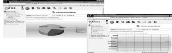
Σχήμα 1. Δείκτες δραστηριότητας στο περιβάλλον INSPIRE: σειρά επίσκεψης & χρόνος ενασχόλησης εκπαιδευόμενου με εκπαιδευτικό υλικό διαφόρων τύπων & επιπέδων

Τα περιβάλλοντα που ενσωματώνουν ανάλυση αλληλεπίδρασης, χρησιμοποιούν διάφορες μορφές οπτικοποίησης της πληροφορίας όπως (Γιαννακάς, 2009): (α) κοινωνιοδιαγράμματα ή κοινωνιογράμματα (Dias - βλέπε Σχήμα 2 όπου κάθε χρήστης αναπαριστάται με μία κόκκινη βούλα. Ένα βέλος ανάμεσα σε δύο χρήστες υποδεικνύει την ανάγνωση μηνυμάτων του δεύτερου από τον πρώτο), (β) γραφικές αναπαραστάσεις όπως πίτες (INSPIRE, CoolModes, FreeStyler), καρτεσιανά διαγράμματα (INSPIRE, Dias), ραβδογράμματα (Dias, Synergo, ModellingSpace, ActiveMath, GISMO), ιστογράμματα (GISMO), πολικά διαγράμματα (Dias), διαγράμματα γραμμής (ACT, βλέπε Σχήμα 3), (γ) δενδροδιαγράμματα