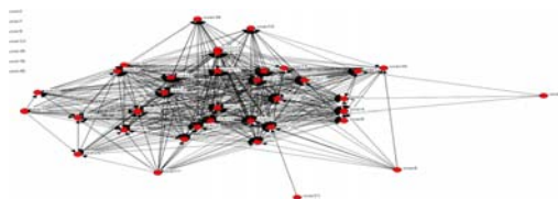
Σχήμα 2. Κοινωνιόγραμμα Αναγνώσεων μηνυμάτων στο περιβάλλον Dias

ή δέντρα αποφάσεων (Dias, ActiveMath), (δ) πολυεπίπεδες όψεις (ColAT), (ε) πίνακες (CoolModes, FreeStyler), (ζ) μεταφορές (VisMode, VisNet, i-tree).