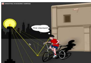
Σχήμα 1. Πώς βλέπουμε

Ωστόσο, τα αποτελέσματα μιας έρευνας (Buty, 2002), αν και κατέδειξαν την αποτελεσματικότητα της χρήσης του συγκεκριμένου λογισμικού στην εισαγωγή ενός υλικού μοντέλου (materialized model) με στόχο τη δημιουργία σύνδεσης ανάμεσα στον πραγματικό κόσμο, των αντικειμένων και γεγονότων και των κόσμο των μοντέλων, δηλαδή των ιδεών και θεωριών, επισήμαναν ότι αυτό απαιτεί περισσότερο ακριβείς και ρητές διαδικασίες από το δάσκαλο. Για να ξεπεραστούν οι περιορισμοί αυτοί, στη συγκεκριμένη ΔΜΣ, επιχειρείται η γεφύρωση ανάμεσα στα πραγματικά φαινόμενα και το μοντέλο κατά τη διάρκεια τριών σταδίων τα οποία αντιστοιχούν σε τρία διαφορετικά επίπεδα αφαίρεσης. Κατά τη διάρκεια του πρώτου σταδίου οι μαθητές μοντελοποιούν τη διαδικασία του πώς βλέπουμε χρησιμοποιώντας ένα flash applet (Σχήμα 1) και αντιλαμβάνονται ότι ενώ υπάρχουν πολλές δέσμες φωτός γύρω από μια πηγή εμείς επιλέγουμε μόνο μια για να ερμηνεύσουμε το φαινόμενο.