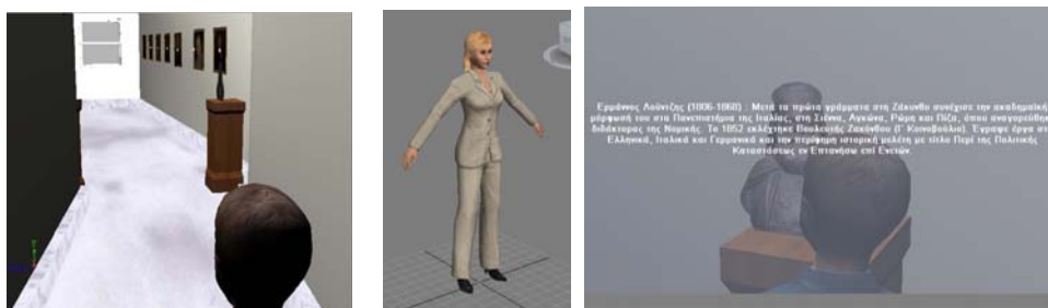
Σχήμα 2. (α) Ξεναγός-παιδί με κάμερα τρίτου προσώπου (β) Εικονική Ξεναγός, (γ) Παρουσίαση περιγραφής εκθέματος σε μορφή κειμένου

χώρο που είναι πιθανό να επηρεάσει την περιήγηση στο σύνολό της. Κρίθηκε σκόπιμο να έχει ο χρήστης τη δυνατότητα επιλογής της κάμερας κατά την εκκίνηση της εφαρμογής ανάλογα με αυτό που του ταιριάζει, αφού η επιλογή της συμβάλλει ως ένα βαθμό στην ομαλή πλοήγηση του χρήστη στο χώρο.