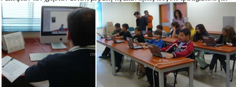
Σχήμα 3. Τυπικές εικόνες από την αξιολόγηση του ΜΕΣ: (α) φάση Α, ενήλικοι χρήστες, (β) Φάση Β, μαθητές γυμνασίου

Ως προς την αντίληψη του χώρου , οι χρήστες μετά την επίσκεψη κλήθηκαν να απαντήσουν στο ερώτημα πόσες αίθουσες είχε ο ένας από τους δύο ορόφους του μουσείου. 84% απάντησαν σωστά στην ερώτηση αυτή, ένδειξη ότι απέκτησαν καλή αντίληψη του χώρου.