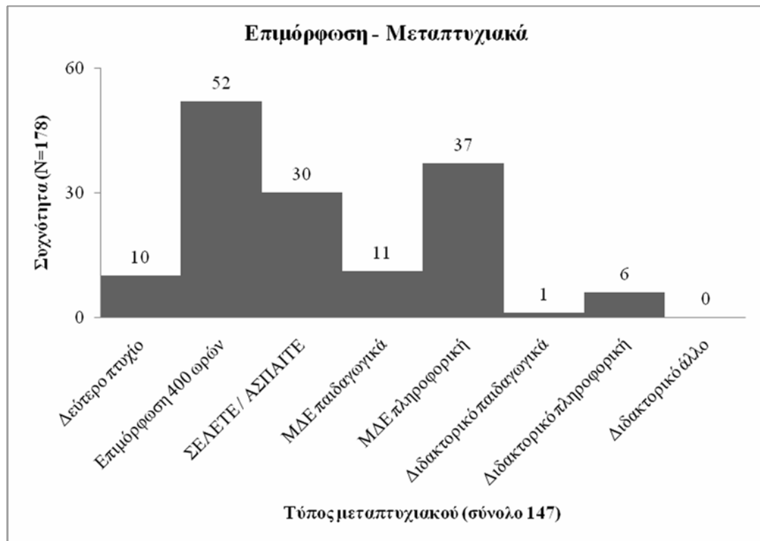
Σχήμα 2: Επιμόρφωση και μεταπτυχιακές σπουδές των εκπαιδευτικών

μικρότερα είναι τα ποσοστά κατοχής διδακτορικών διπλωμάτων σε θέματα σχετικά με την πληροφορική (3.4%) και τα παιδαγωγικά (.6%).