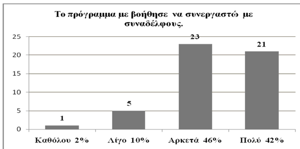
Γράφημα 5: Ενίσχυση της διάθεσης για συνεργασία

πρόγραμμα ήταν λίγο κοπιαστικό για αυτούς. Τέλος οι εκπαιδευτικοί που συμμετείχαν στην επιμόρφωση Β' επιπέδου, δήλωσαν σε ποσοστό 60% πως το πρόγραμμα τους πρόσφερε μια αφετηρία για προβληματισμό σε πολύ μεγάλο βαθμό και το υπόλοιπο 40% σε αρκετό