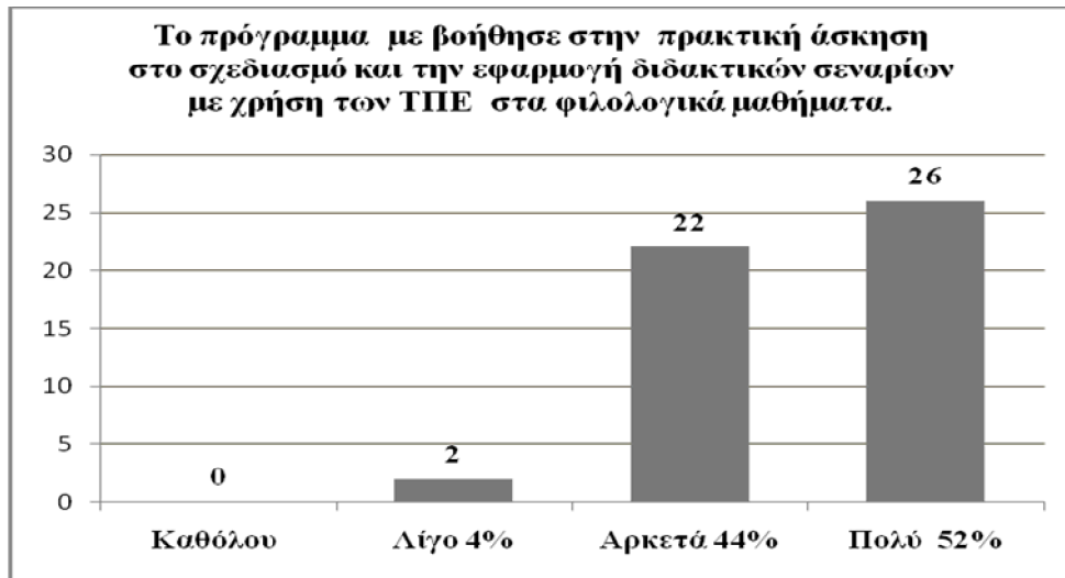
Γράφημα 3: Πρακτική άσκηση και εκπόνηση διδακτικών σεναρίων με χρήση των ΤΠΕ

Στην ερώτηση κατά πόσο θεωρούν οι εκπαιδευτικοί πως η συμμετοχή τους στο πρόγραμμα τους βοήθησε να προετοιμαστούν για τις μελλοντικές εξελίξεις στο χώρο της εκπαίδευσης, 94% καταθέτουν θετική άποψη, σημειώνοντας πολύ/ αρκετά, ενώ μόνο το 6% δηλώνουν πως το πρόγραμμα τους βοήθησε λίγο να προετοιμαστούν για τις μελλοντικές αλλαγές.