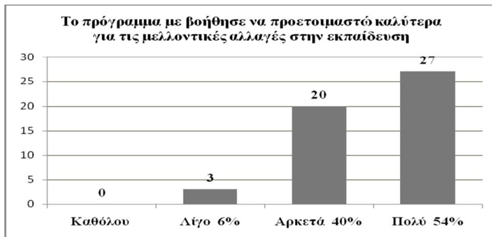
Γράφημα 4: Προετοιμασία για μελλοντικές αλλαγές

Στην ερώτηση κατά πόσο θεωρούν οι εκπαιδευτικοί πως η συμμετοχή τους στο πρόγραμμα τους βοήθησε να προετοιμαστούν για τις μελλοντικές εξελίξεις στο χώρο της εκπαίδευσης, 94% καταθέτουν θετική άποψη, σημειώνοντας πολύ/ αρκετά, ενώ μόνο το 6% δηλώνουν πως το πρόγραμμα τους βοήθησε λίγο να προετοιμαστούν για τις μελλοντικές αλλαγές.