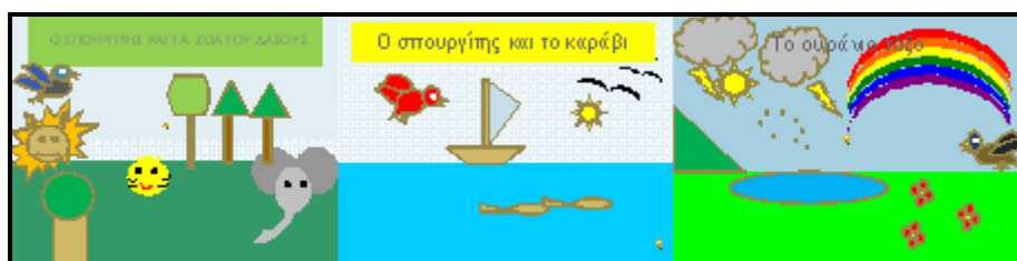
Εικόνα 4: Δημιουργίες ομάδων «Μεγάλο Δάσος», «Μεγάλη Θάλασσα», «Μεγάλη Πεδιάδα»

Οι δραστηριότητες που σχεδιάστηκαν στα διάφορα Φύλλα Εργασίας πραγματοποιήθηκαν από όλες τις ομάδες. Έκαναν την εισαγωγή και επεξεργασία των Βασικών Σχημάτων, πειραματίστηκαν και έπαιζαν με τα χρώματα απολαμβάνοντας την όλη διαδικασία. Εντοπίστηκαν δυσκολίες στην αντιγραφή και επικόλληση των σχημάτων και στην ομαδοποίησή τους, οι οποίες ξεπεράστηκαν με τη βοήθεια των εκπαιδευτικών. Η φαντασία των παιδιών ξεπέρασε τις προσδοκίες των εκπαιδευτικών και οι συνθέσεις τους υπήρξαν πρωτότυπες. Για την παραγωγή γραπτού λόγου, χρησιμοποίησαν όχι μόνο το χαρτί αλλά και την οθόνη του υπολογιστή, γεγονός που παρείχε ευκαιρίες σε περισσότερους μαθητές να αναδείξουν κλίσεις και ενδιαφέροντα.