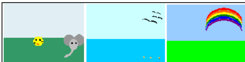
Εικόνα 3: Καμβάς ομάδων «Μεγάλο Δάσος», «Μεγάλη Θάλασσα», «Μεγάλη Πεδιάδα»

Μοιράσαμε στις ομάδες το Φύλλο εργασίας 3 , και οι μαθητές σχεδίασαν στη Διαφάνεια 4 αυτό που φαντάστηκαν ότι ονειρεύτηκε ο σπουργίτης, όταν ολοκλήρωσε το ταξίδι του. Αφήσαμε τους μαθητές να εκφραστούν ελεύθερα χωρίς παρεμβάσεις. Στο ίδιο φύλλο εργασίας υπήρχε η δραστηριότητα παραγωγής γραπτού λόγου, η οποία πραγματοποιήθηκε μετά την ολοκλήρωση της παρουσίασης.