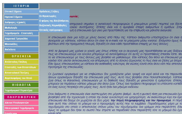
Σχήμα 2: Κεντρική σελίδα της διεπαφής με το μενού

Κατά τη διαδικασία του σχεδιασμού δόθηκε έμφαση στην οργάνωση της πληροφορίας και ιδιαίτερα στην αποτελεσματική και φιλική παρουσιάσή της στις επιλογές της εφαρμογής. Η κεντρική οθόνη, Σχήμα 2, περιλαμβάνει μια γενική εισαγωγή στην έννοια της επικοινωνίας και παρουσιάζονται οι θεματικές ενότητες πάνω στις οποίες εργάστηκε η ομάδα. Με τη βοήθεια ενός εύχρηστου μενού ο χρήστης μπορεί να ανακαλύψει τη γνώση μέσα από εικόνες και κείμενα, όπως για παράδειγμα, το «Ταχυδρομείο στην Κρήτη», Σχήμα 3.